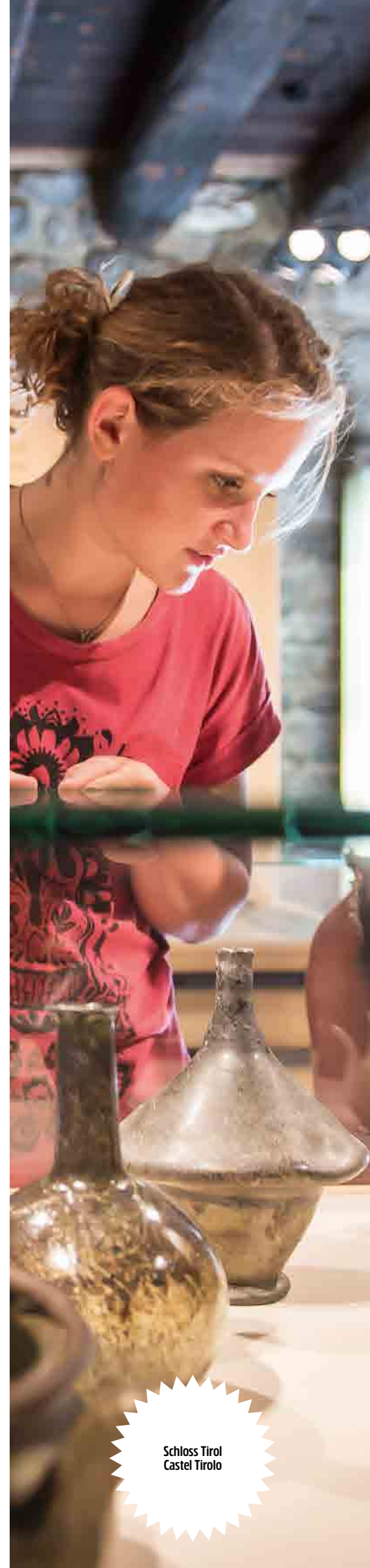
Schloss Tirol Castel Tirolo