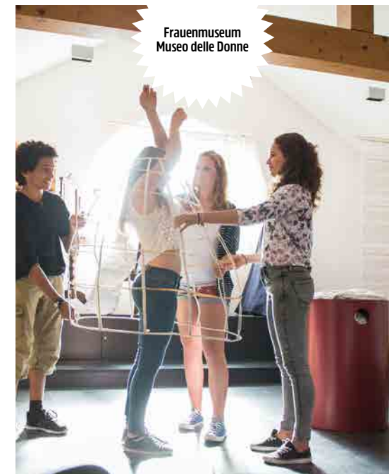
Frauenmuseum Museo delle Donne

Este corius? Dailò informèiete sot youngandmuseum.it sön le program da d'istè di museums dl Südtirol. Sön chësta cherta vèigheste co fà da rovè ilò le plü sauri cun i mesi publics. Informaziuns plü menüdes é da cialfé sot suedtirolmobil.info o tres l'app dl smartphone „Sudtirol2Go“.