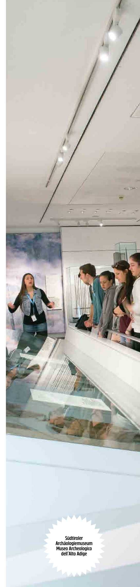
Südtiroler Archäologiemuseum Museo Archeologico dell'Alto Adige

Curiosa? Curioso? Allora vai su youngandmuseum.it per conoscere il programma estivo dei musei dell'Alto Adige. Su questa cartina puoi vedere come arrivarci al meglio con i mezzi pubblici. Informazioni più precise su suedtirolmobil.info o con la app per smartphone „AltoAdige2Go“.